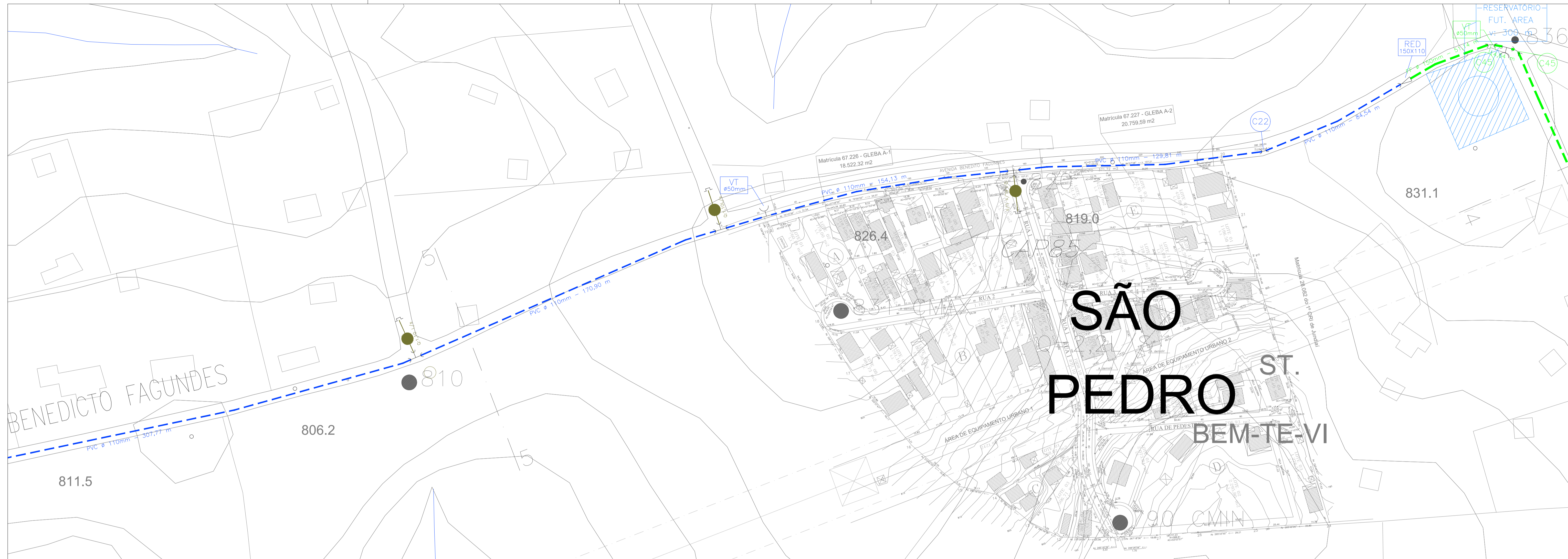
IMPLANTAÇÃO DAS ADUTORAS E REDES

CAIXA DE V.R.P. DN 150mm - ATE 1200 mm ALÉM DA V.R.P. 150mm