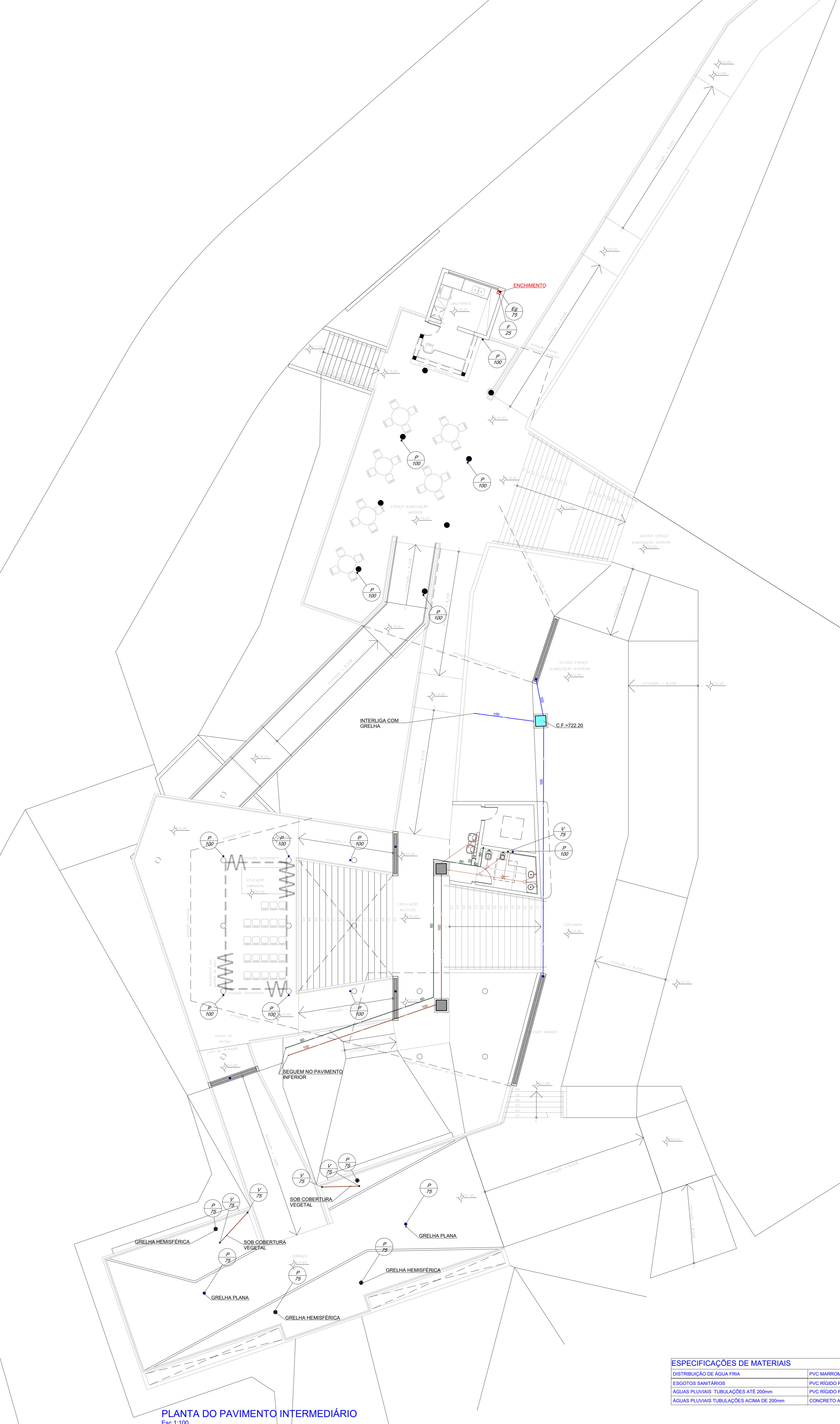
PLANTA DO PAVIMENTO INTERMEDIÁRIO Esc: 1:100