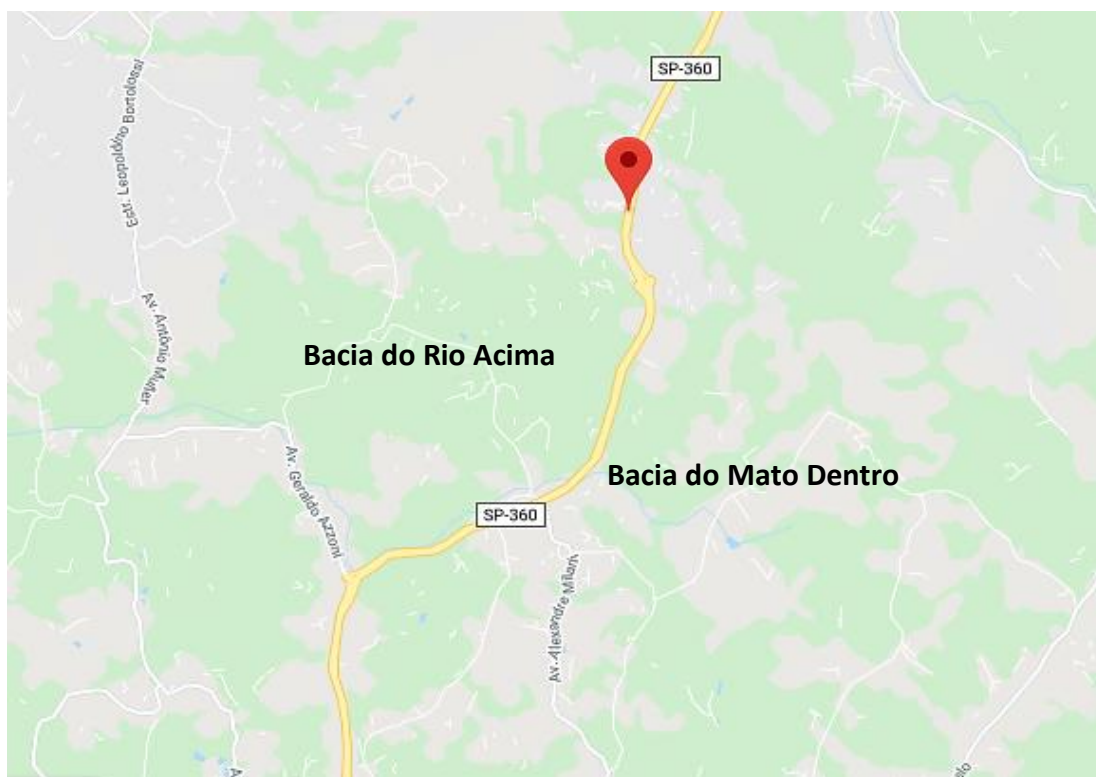
Figura 02: Área de abrangência dos estudos. Google Maps® (2022).

Vale mencionar que a Rodovia Engenheiro Constâncio Cintra (SP -360), divide a região de abrangência das obras, sendo assim, o trabalho será sempre direcionado para as duas regiões: Bacia do Rio Acima e Bacia do Mato Dentro, conforme a Figura 02 abaixo: