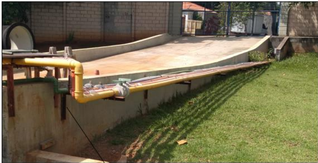
Retirada de 06 suportes de tubulação existente