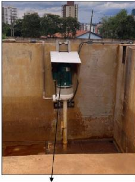
Bomba de drenagem a ser removida