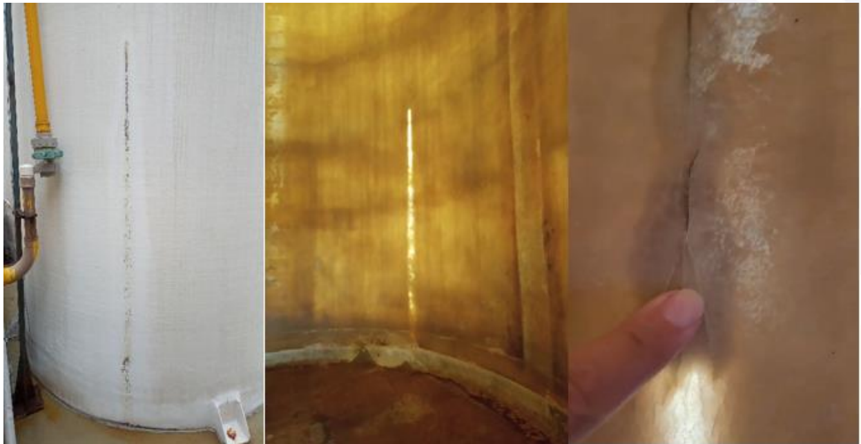
Figura 5. Foto da parede externa e interna do tanque 2 no ponto de ocorrência do vazamento.

Um dos tanques o de nº 3 em planta, apesar dos indicativos de provável colapso, não apresentou vazamentos, diferente do tanque de número nº 2, que antes mesmo de sofrer inspeções internas iniciou um processo de colapso apresentando vazamento quando em operação.