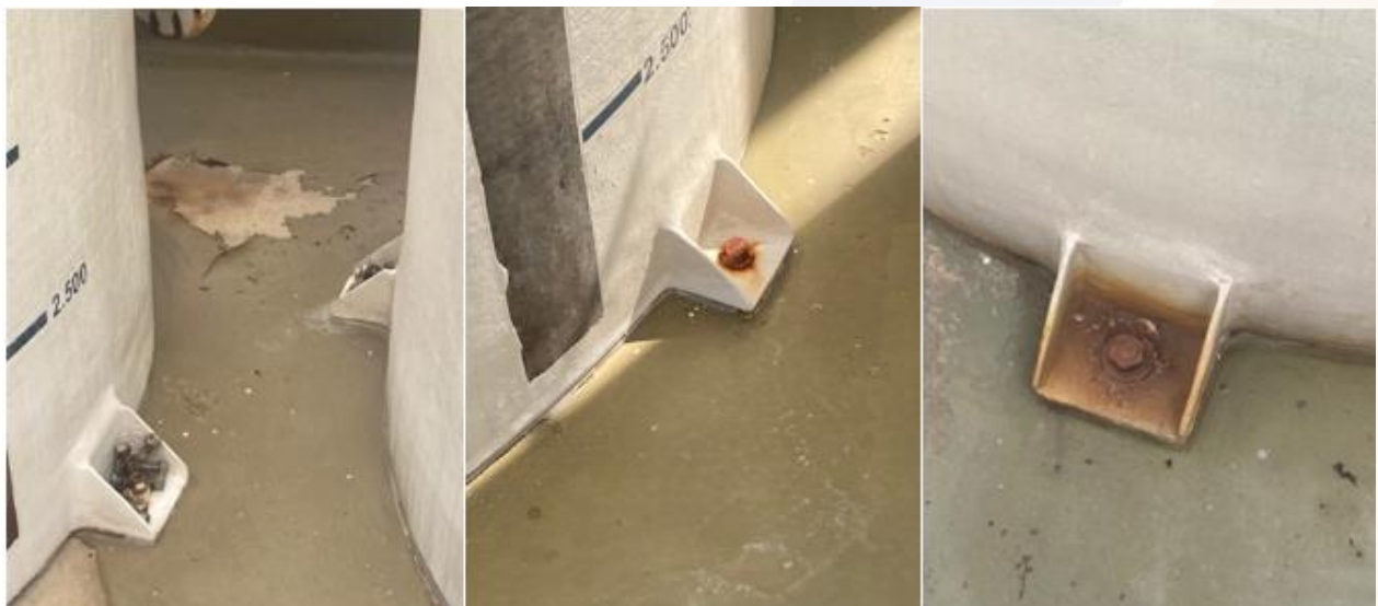
Figura 4. Fotos da instalação da base dos tanques com fixação direta no solo.

Foram realizadas avaliações tanto da área interna quanto externa dos tanques, sendo um consenso entre os técnicos que a estrutura externa dos tanques demonstra características que não inviabilizam seu uso, porém a base de apoio/ fixação dos tanques reduz a condição de flexibilidade e de vibração do costado e fundo do tanque. Sendo necessário que seja realizada adequação do modo de fixação/base de apoio.