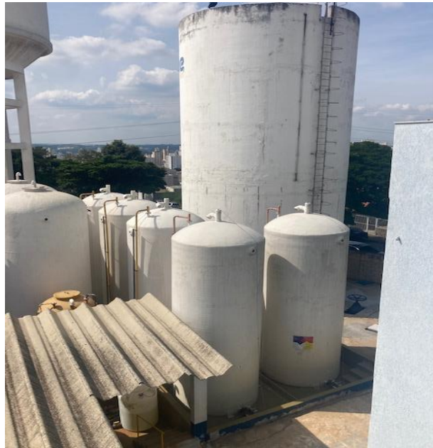
Figura 3. Na foto é possível observar a dimensão dos reservatórios bem como a proximidade da via.

Foram realizadas avaliações tanto da área interna quanto externa dos tanques, sendo um consenso entre os técnicos que a estrutura externa dos tanques demonstra características que não inviabilizam seu uso, porém a base de apoio/ fixação dos tanques reduz a condição de flexibilidade e de vibração do costado e fundo do tanque. Sendo necessário que seja realizada adequação do modo de fixação/base de apoio.