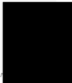
[Name] DE LIMA